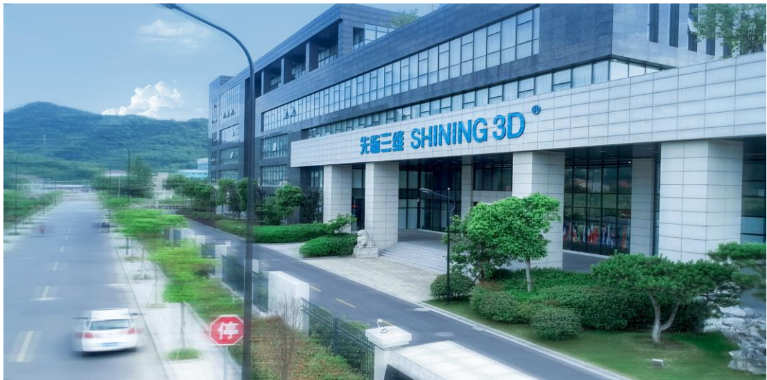
▲公司 3D 产业园外景

先临三维科技股份有限公司成立于 2004 年 12 月 3 日， 2014 年 8 月 8 日在新三板挂牌(证券代码: 830978)。先临三维致力于成为具有全球影响力的 3D 数字技术企业，推动高精度 3D 数字技术的普及化应用。