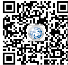
先临三维数字化齿科