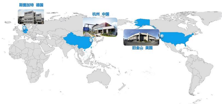
▲公司的海外分支机构