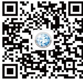
先临三维数字化与 3D 打印